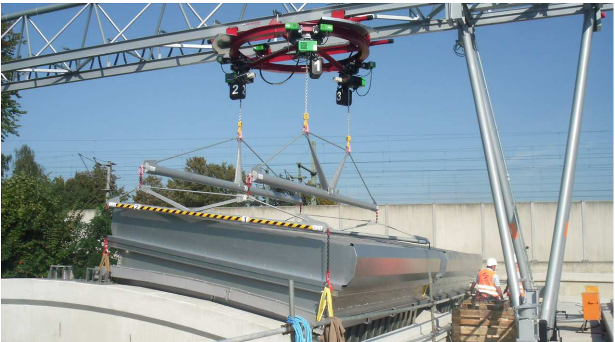
Vor Ort Montage.