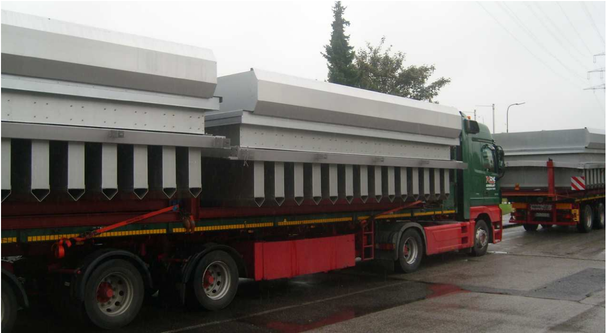
Der Schwerlasttransport erfolgte über die Autobahn.