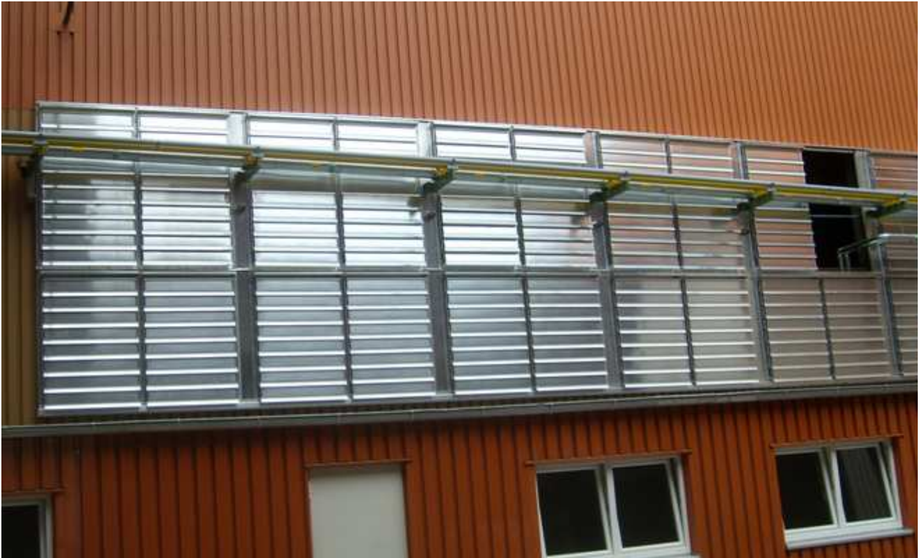
Zuluftjalousien in den Gebäudefassaden.