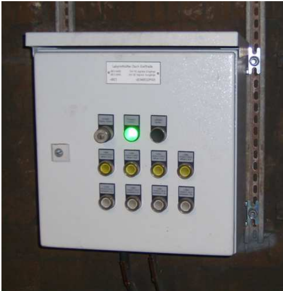
Vor Ort Steuerschrank mit Anschluss an vorhandene Winn CC.