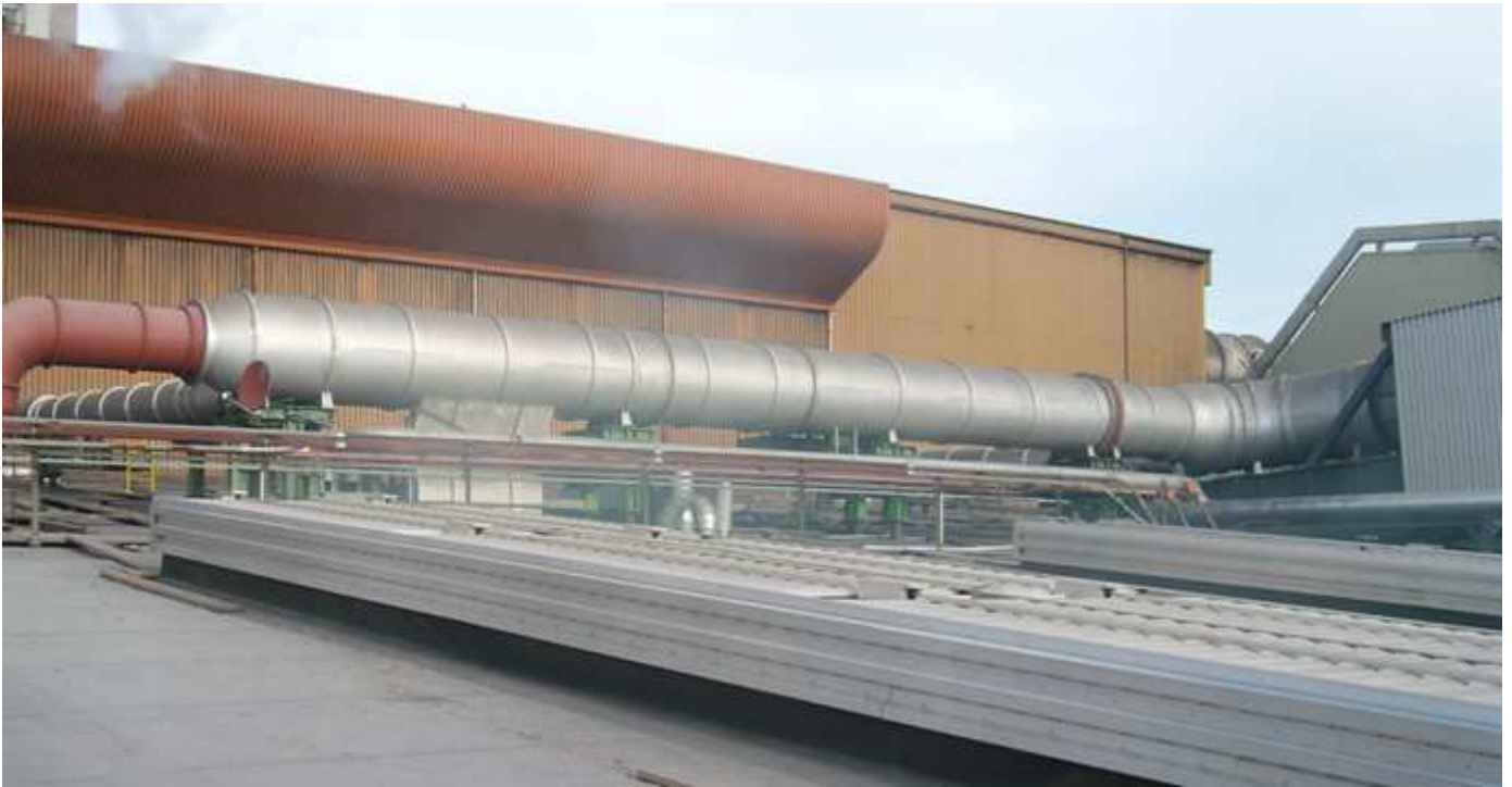
Regensichere Abluftgeräte auf dem Kesselhausdach.